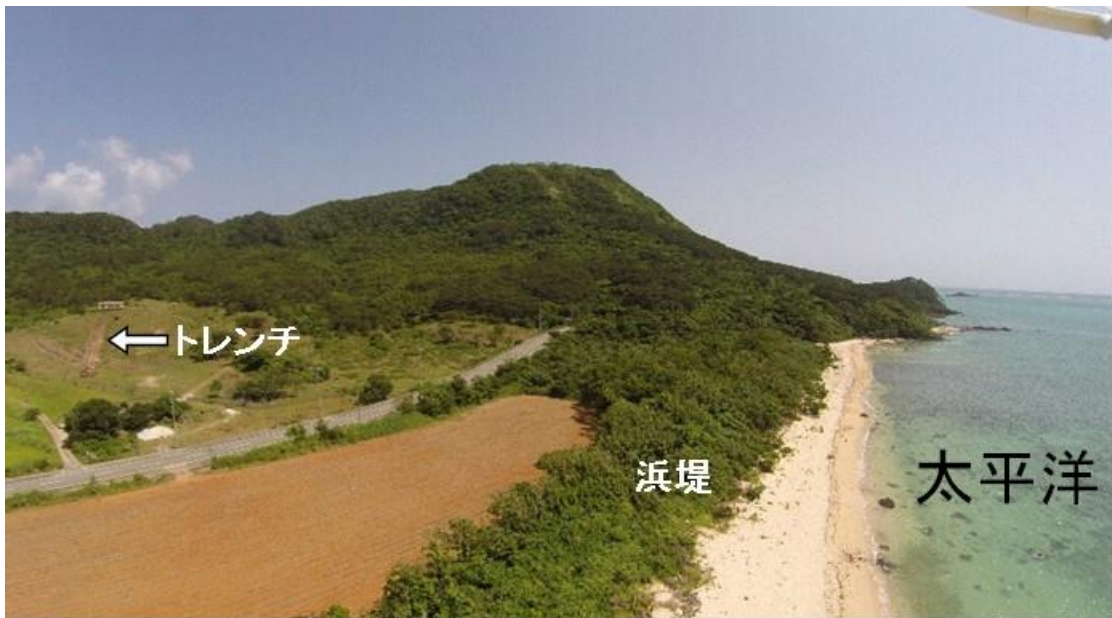
図2 砂質津波堆積物の見つかったトレンチ