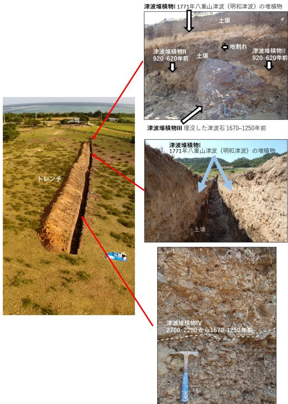
図3 津波堆積物 I, II, III, IV と「地割れの痕跡」の写真