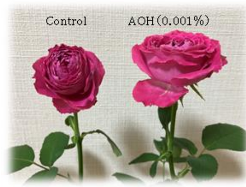
図2. バラの切り花に対する AOH の効果（1週間後）