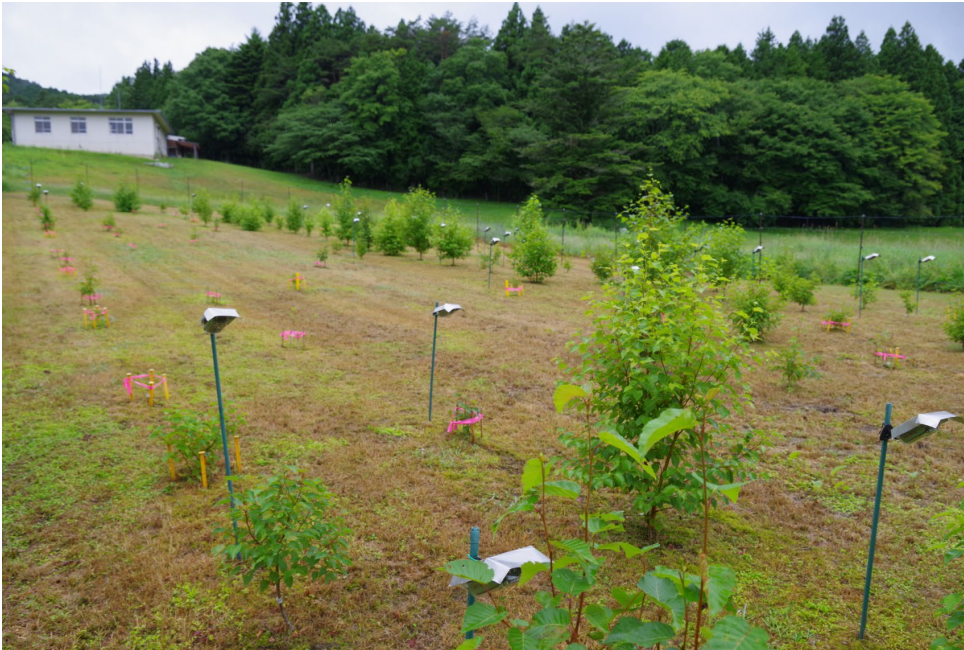
図1 産地試験地の様子

本研究では、日本全国8カ所に設置されているダケカンバの産地試験地を使用した。1試験地につき11産地集団由来のダケカンバ苗木を計183本植栽した。写真は愛知県設楽町に設置されている試験地(名古屋大学設楽試験地)。2022年7月4日に相原隆貴撮影。