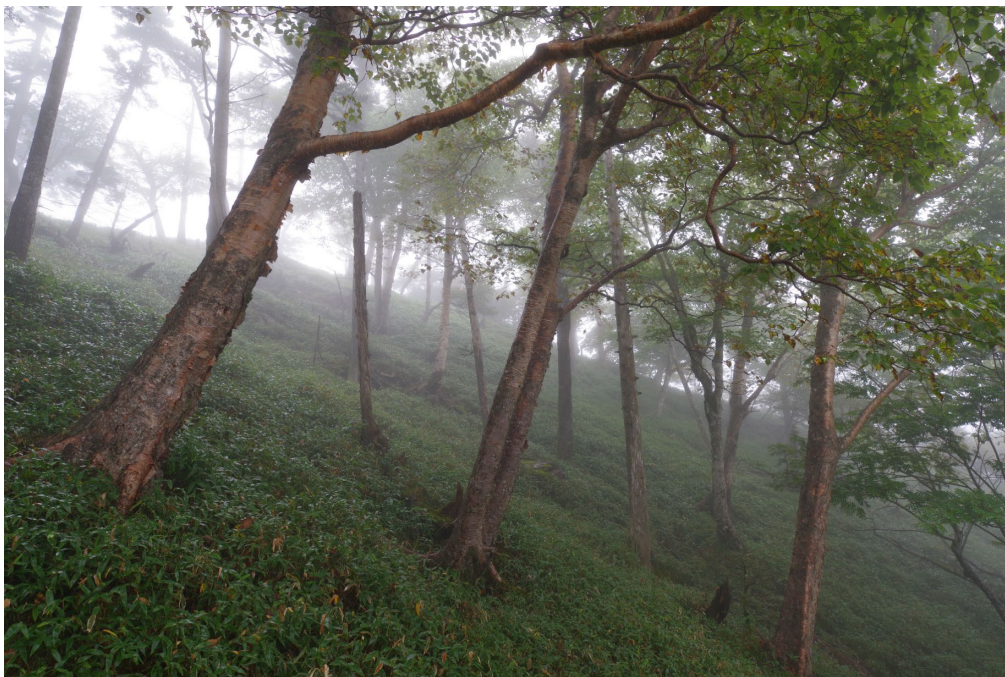
図4 紀伊半島釈迦ヶ岳のダケカンバ林の様子

白丸は平均値、縦線は標準偏差を表す。各グラフの黒の横線は全体の平均値を表す。紀伊半島と中央アルプスの集団が他集団に比べ、生存率・樹高が低いことが記録された。また、紀伊半島の集団はこれに加え、樹高成長率も低かった。