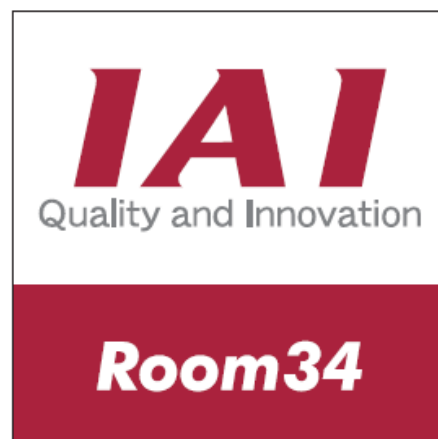
当該施設に設置される愛称名看板