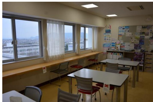
5階 リフレッシュルーム