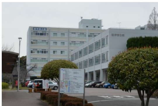
理学部 A 棟