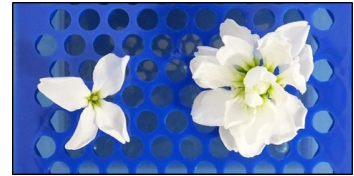
豪華な八重咲きの花(右)