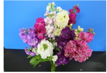
色とりどりのストックの花