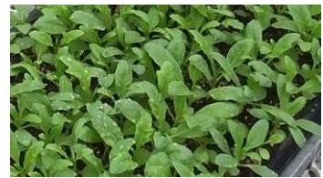
どの苗が八重咲きかな？