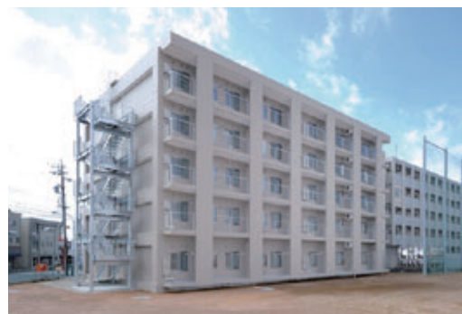
浜松国際交流会館 1号館 Hamamatsu International Residence NO.1