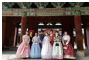
朝鮮大学校夏季短期留学 Summer Tour to Chosun University