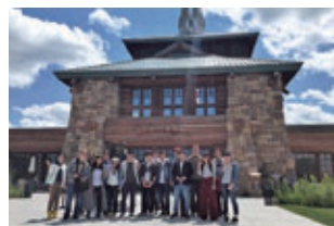
ネブラスカ大学オマハ校 夏季短期留学 Summer Tour to University of Nebraska at Omaha