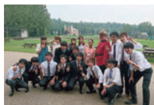
アルバータ大学 夏季短期留学 Summer Tour to University of Alberta