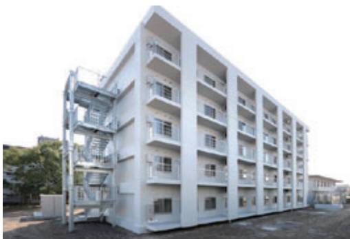
静岡国際交流会館 Shizuoka International Residence