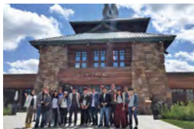
ネブラスカ大学オマハ校 夏季短期留学 Summer Tour to University of Nebraska at Omaha