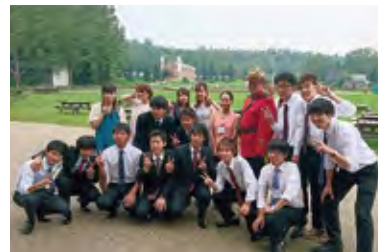
アルバータ大学 夏季短期留学 Summer Tour to University of Alberta