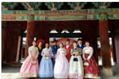
朝鮮大学校 夏季短期留学 Summer Tour to Chosun University