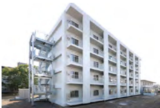
静岡国際交流会館 Shizuoka International Residence