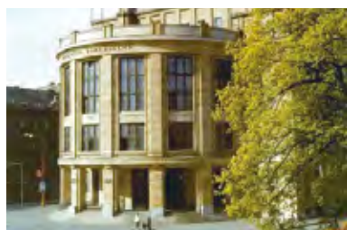
コメニウス大学 Comenius University