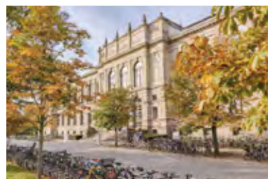
ブラウンシュバイク工科大学 Technical University of Braunschweig