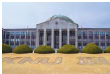
慶北大学校 Kyungpook National University