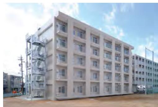
浜松国際交流会館 2号館 Hamamatsu International Residence NO.2