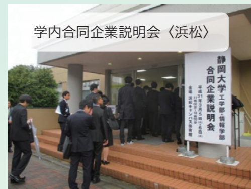
学内合同企業説明会〈浜松〉