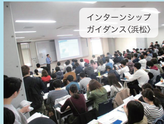
インターンシップ ガイダンス(浜松)