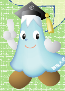
しずおかだいがく 静岡大学キャンパスキャラクター 「しずっぴー」

この地図をおともだちと合わせてつかうと しずおかだいがく せんたい 静岡大学の全体がみられるよ \ (^^) / どこを合わせたら地図が完成するかな??